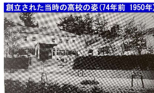
創立された当時の高校の姿(74年前 1950年)