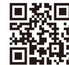
大阪暁光高等学校のホームページはこちら