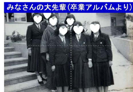
みなさんの大先輩(卒業アルバムより)