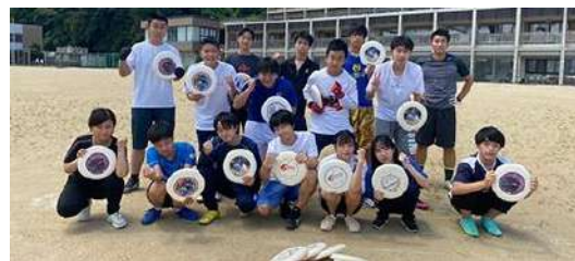
アルティメット部